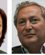
المهندس سميح ساويرس رئيس مجلس إدارة شركة أوراسكوم للفنادق والتنمية